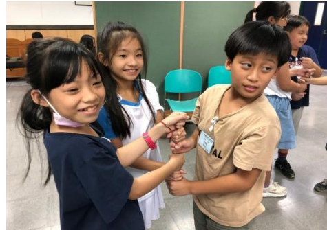
利用體驗教學，讓學生做中學