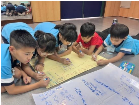
小組分享各自的優點，共同開一家店，一起製作商家海報