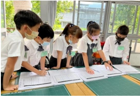
學生自行討論適合的學習方式，呈現不同的課堂風景