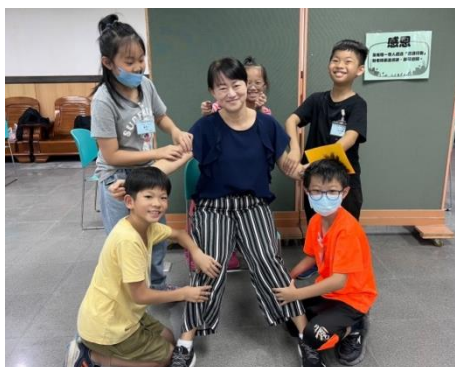
利用闖關活動帶領學生回顧一週所學，並邀請導師擔任感恩關主，讓學生練習表達感恩的實際行動