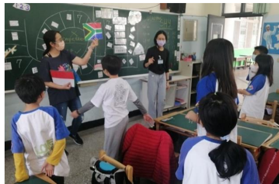
英文課利用龜兔賽跑故事結合大富翁遊戲，將「決心」好品格以遊戲化方式教學